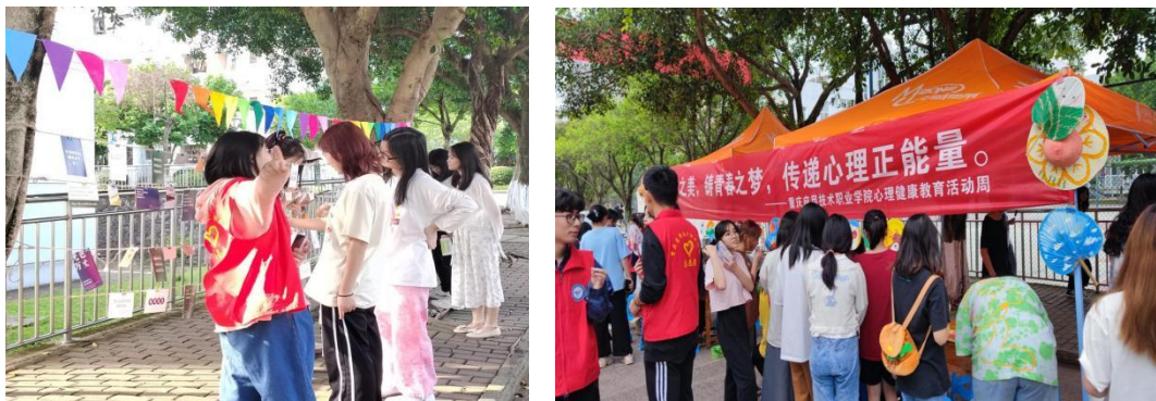
图2 心理健康教育活动周

不断推进大学生心理健康教育和咨询中心建设工作，充实人员配备，调整机构设置。成立大学生心理健康教育与咨询科室，配备2名专职教师，3名兼职心理咨询师。中心本年度共接待主动来访学生114人次，紧急危机干预学生17人次。针对新生进行学生心理测评2次，在校大学生测评1次，合计完成测评七千余人次，针对测出不同程度有心理问题的学生和有严重心理问题的学生，分类型分阶段分情况进行了一定的咨询、干预，达到了一定的效果。