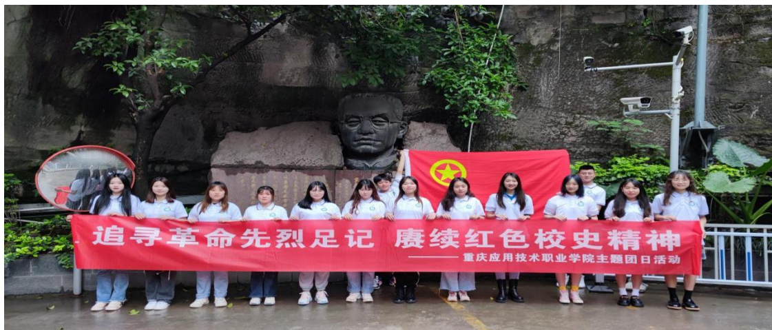
图 1 追寻革命先烈足迹 赓续红色校史精神